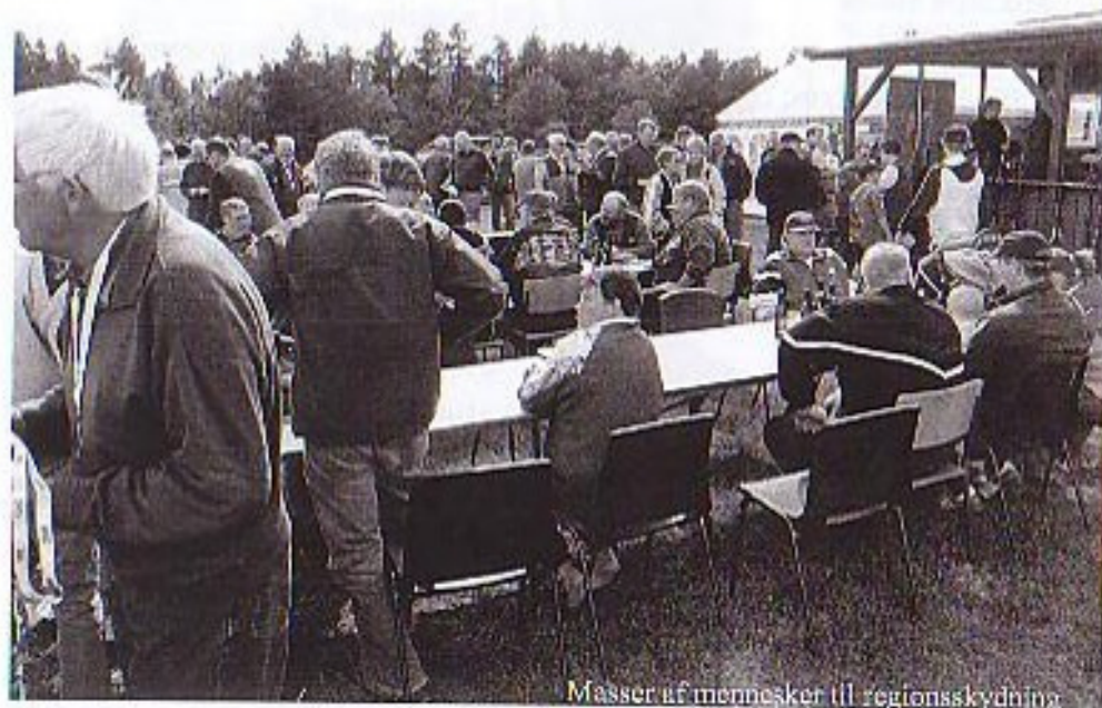
Masser af mennesker til regionsskydning

Læs inde i bladet: Jagter i efteråret Ny hjemmeside