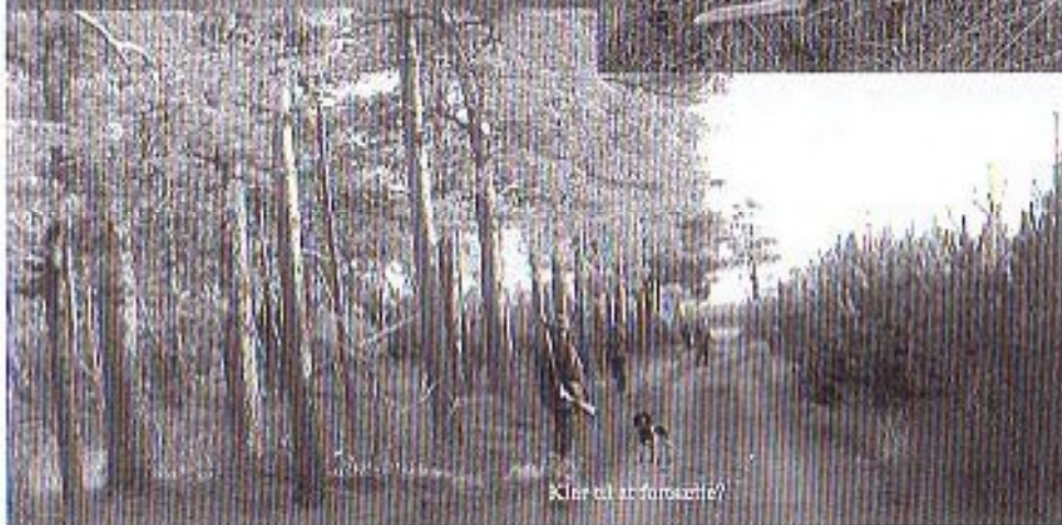
Klar til at forsætte!