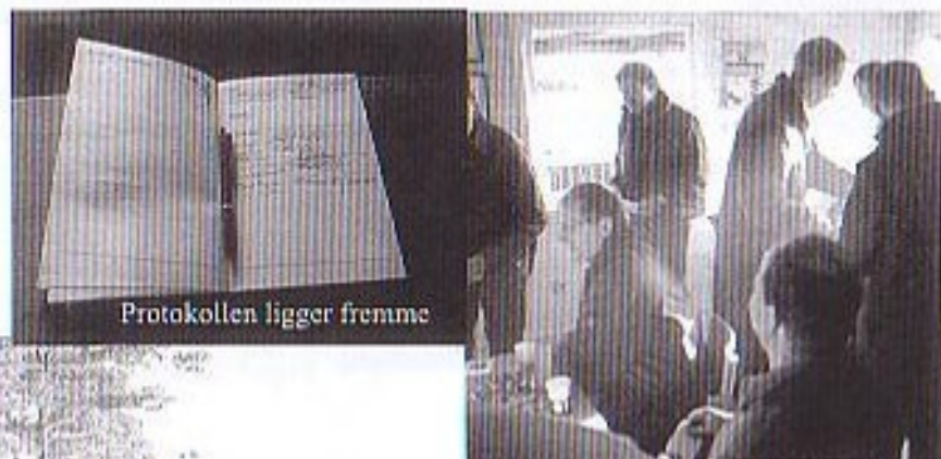
Protokollen ligger fremme