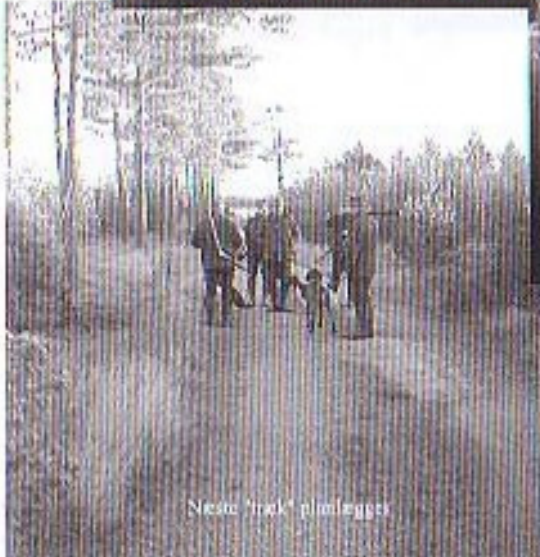
Neste "træk" pliminges!